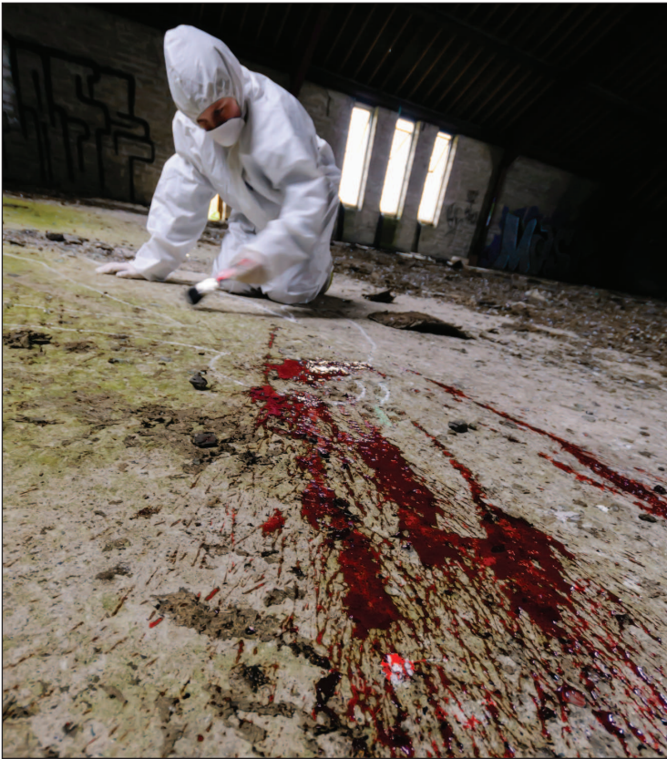
Офицер, работающий на месте преступления, изучает следы крови на земле и область вокруг них.

На улице делают фотографии и слепки отпечатков подошвы обуви и следов шин. Наконец, прежде чем тело заберут, на руки и ноги трупа надевают пластиковые или бумажные пакеты.