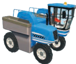
Машина для сбора винограда

Реши судoku с помощью наклеек. Помни, аграрная техника не должна повторяться в колонках и строках.