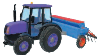
Трактор с сеялкой