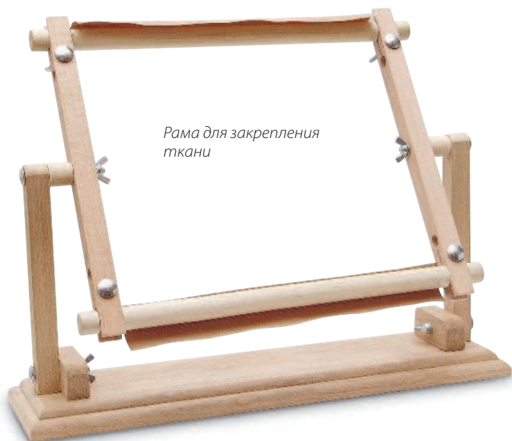
Рама для закрепления ткани