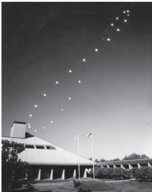
За год солнце описывает на небосклоне восьмиобразную кривую. Астрономы назвали эту кривую «аналеммой»

Примерно 10 000 лет назад мы занимались строительством массивных часов, чтобы придерживаться естественного ритма изменений на небосклоне. В 2004 году команда археологов обнаружила в Шотландии остатки сооружений каменного века, относящихся к этому времени. К началу 2013 года они наконец-то поняли, с какой целью эти сооружения были созданы. Архитекторы периода древности выкопали двенадцать углублений вдоль дуги длиной в 50 метров — по одной для каждого из двенадцати полных лунных циклов, которые в норме все вместе соответствуют году (иногда образуются тринадцать