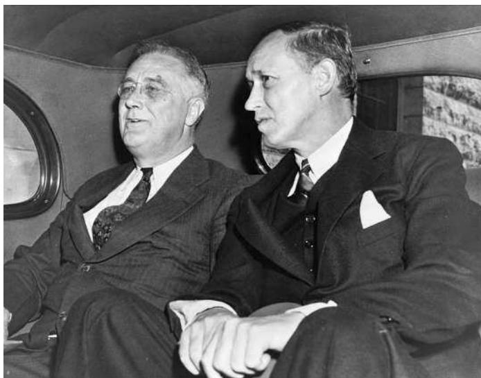
Гарри Гопкинс и президент Франклин Рузвельт

личества острых социальных проблем. Более того, в 1929 году в США началась Великая депрессия — тотальный кризис, сопровождавшийся массовой безработицей. В сложившейся ситуации губернатору-демократу как нельзя кстати пришлось таланты и профиль деятельности Гарри Гопкинса. Рузвельт, зная Гопкинса заочно, пригласил его на работу в Федеральную чрезвычайную организацию помощи — Комиссию при губернаторе, занимавшуюся оказанием помощи людям, находящимся за чертой бедности, не имеющим работы и страдающим от иных социальных проблем. Именно с этого момента начинается непосредственное сотрудничество