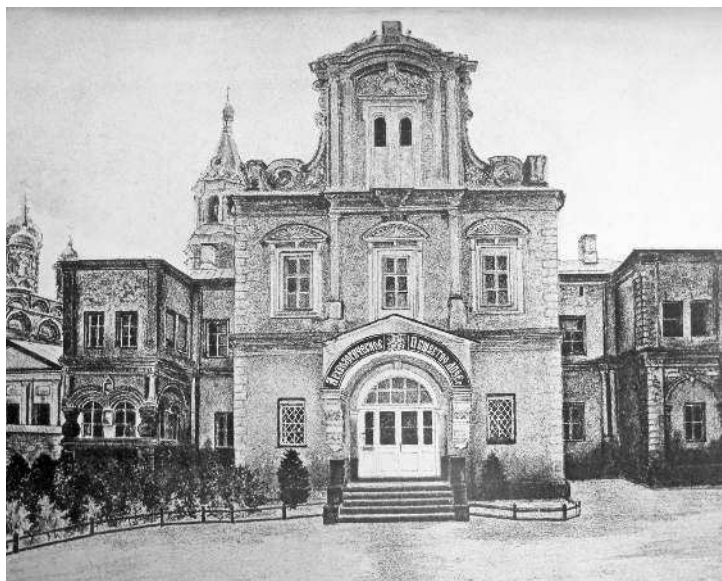
Дом Московского археологического общества на Берсеневской набережной. Палаты Аверкия Кириллова XVII в. Фото XIX в.

лил находки и дал их рисунки (эти рисунки уже достояние России, они разошлись по учебникам мира).