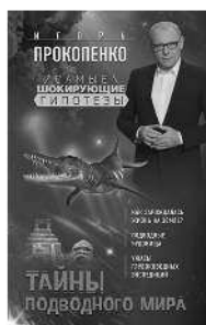
ТАИНЫ ПОДВОДНОГО МИРА