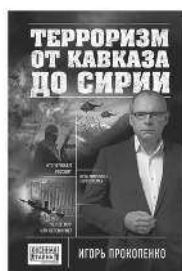
ТЕРРОРИЗМ ОТ КАВКАЗА ДО СИРИИ