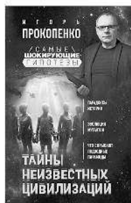
ТАИНЫ НЕИЗВЕСТНЫХ ЦИВИЛИЗАЦИЙ