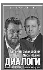
Евгений Сатановский Яков Кедми ДИАЛОГИ