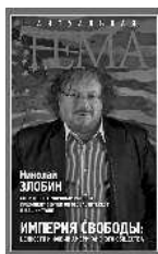
Николай Злобин Империя свободы: ценности и фобии американского общества