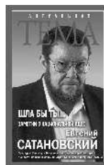
Евгений Сатановский Шла бы ты... Заметки о национальной идее