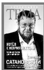
Евгений Сатановский Котёл с неприятностями. Ближний Восток для «чайников»