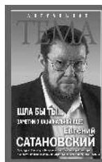
Евгений Сатановский Шла бы ты... Заметки о национальной идее