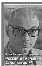
Армен Гаспарян Россия и Германия. Друзья или враги?