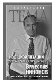
Вячеслав Никонов Код цивилизации. Что ждёт Россию в мире будущего?

Интернет-магазины издательства: https://book24.ru , http://www.labirint.ru/ В электронном виде книги издательства вы можете купить на www.litres.ru