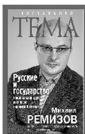
Михаил Ремизов Русские и государство. Национальная идея до и после «крымской весны»