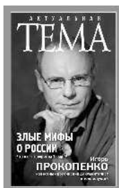
Игорь Прокопенко Злые мифы о России