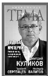
Дмитрий Куликов Судьба империи. Русский взгляд на европейскую цивилизацию