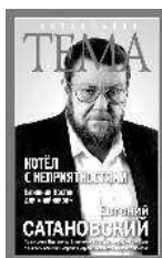
Евгений Сатановский Котёл с неприятностями. Ближний Восток для «чайников»