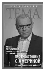
Игорь Прокопенко Противостояние с Америкой. Новая «холодная война»?