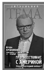
Игорь Прокопенко Противостояние с Америкой. Новая «холодная война»?