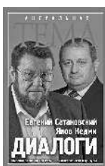
Евгений Сатановский Яков Кедми ДИАЛОГИ