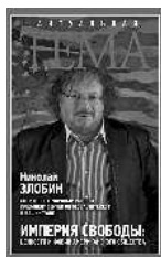
Николай Злобин Империя свободы: ценности и фобии американского общества