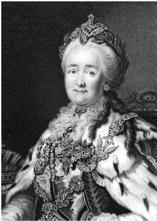
Императрица Екатерина II Алексеевна Великая с 1762 по 1796 год

Есть записки Екатерины Второй, где повествуется о том, как она добиралась в Россию. Там она с удивлением пишет, как впервые увидела настоящую дорогу, когда пересекла границу с Российской империей. Когда она приехала в Ригу, ее приняла жена губернатора, и будущая императрица показала ей сундуки со своим приданым. Губернаторша удивилась: «Ты с этим хочешь поехать к матушке Елизавете?» Екатерина отвечала: «Ну да, мне вся Пруссия собирала приданое, тут и подарки от прусского короля». Но ее себе-