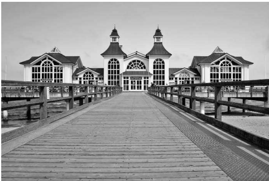
Рюген — самый большой остров Германии, расположен в Балтийском море

К примеру, есть обычай раскрашивания и росписи пасхальных яиц, который восходит к славянской культуре, — такая традиция до сих пор существует в Нидерлаузице. Из дошедших до нас изображений Киевской Руси мы знаем, что раскрашенное яйцо было символом плодородия.