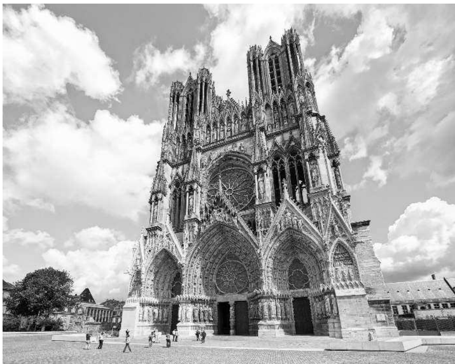
Реймский собор — шедевр готической архитектуры в провинции Шампань, Франция

Это объясняется просто. Реймское Евангелие было частью приданого Анны Ярославны, дочери киевского князя Ярослава Мудрого, ставшей около 1048 года королевой Франции. Источники утверждают, что, когда Анна выходила замуж за короля Франции Генриха Первого, она увезла с собой в Париж в качестве приданого не только золото и брилли-