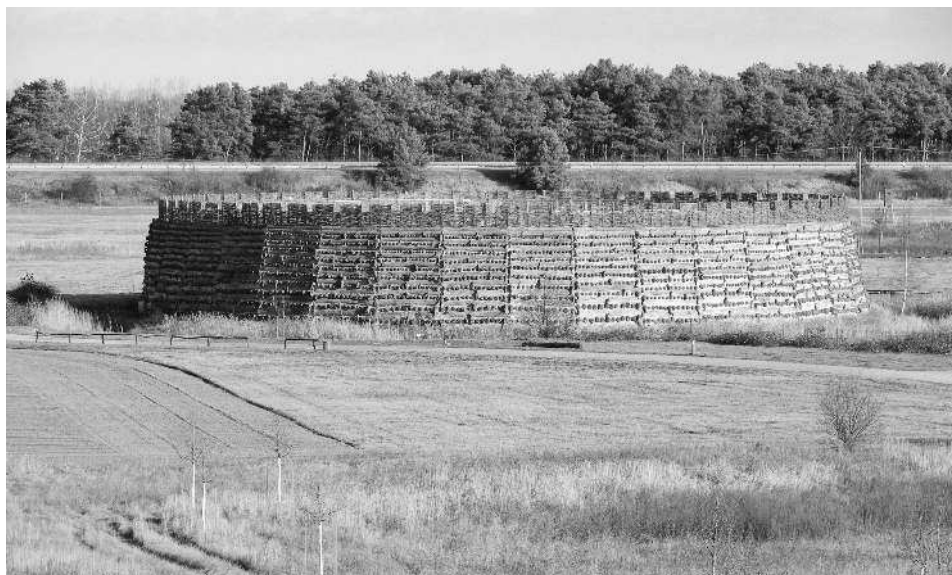
Славянская крепость Раддуш

Так, современные немцы, сами того не замечая, соблюдают традиции, которые сюда когда-то принесли венеды.