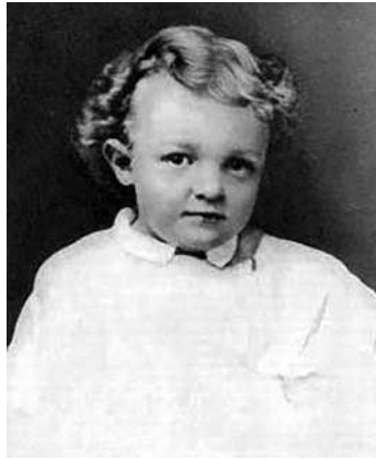
Первый снимок Володи Ульянова. Здесь ему всего четыре года, но кажется, что уже виден знаменитый «ленинский прищур»

которые не сходили с рук другим детям. Правда, и сам Володя никогда не делал ничего исподтишка, а напроказив, сразу же честно сознавался в содеянном. Мальчик с золотыми кудрявыми волосами и бойкими карими глазами — таким вспоминали его впоследствии члены семьи, таким он запечатлен на детских фотографиях.