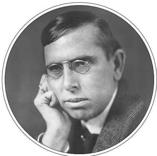
Теодор ДРАЙЗЕР (1871 - 1945)