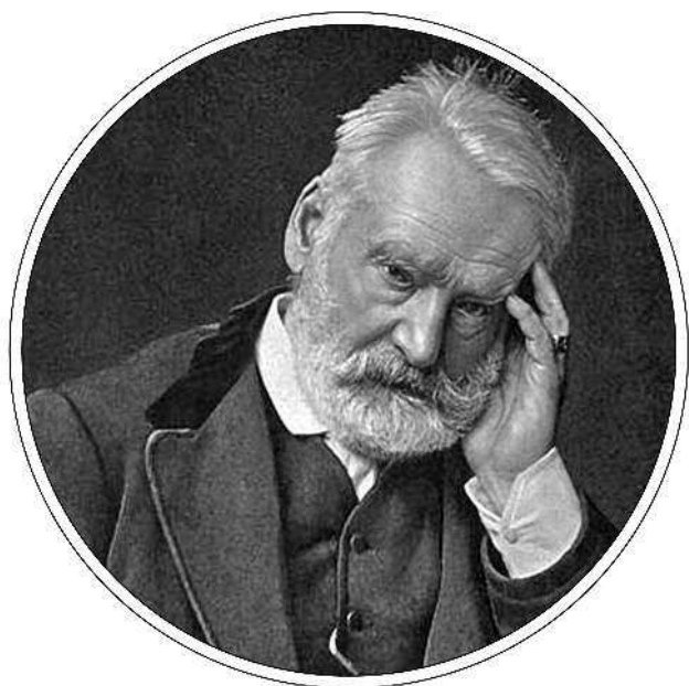
Виктор ГЮГО (1802–1885)