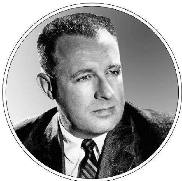
Ри БРЭДБЕРИ (1920-2012)