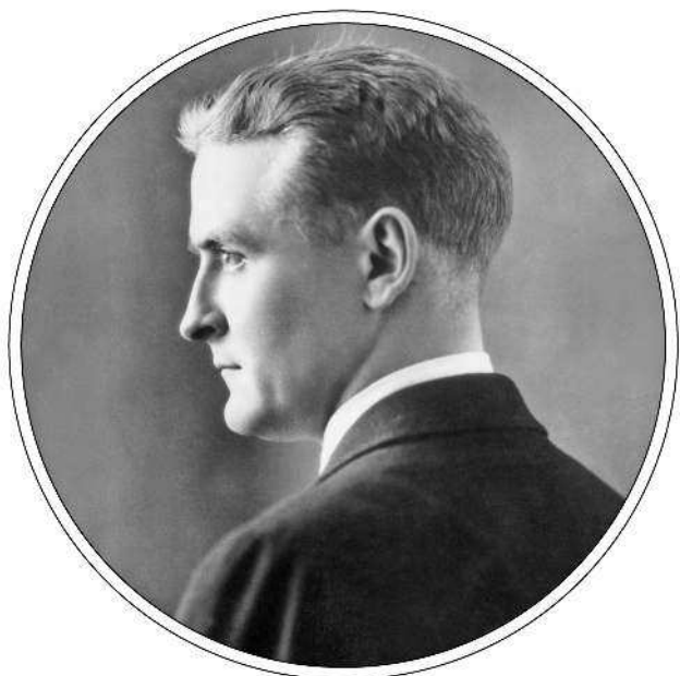
Франсис Скотт ФИЦДЖЕРАЛЬД (1896–1940)