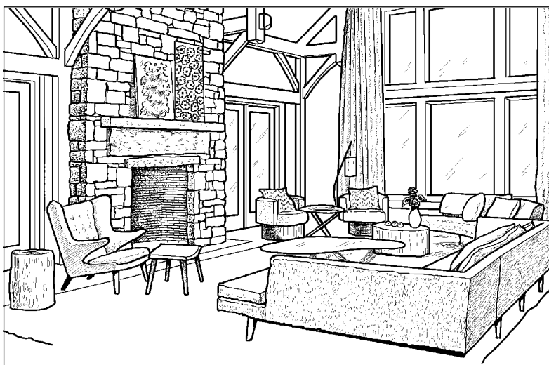
Гостиная в английском стиле

Верность традициям — отличительная черта англичан. В наше время англичане предпочитают старину авангарду, а подлинность — стилизации. Каждое новое поколение обитателей английского дома, не меняя ничего, доставшегося от предков, привносит в обстановку что-то свое. Как следствие предметы мебели в интерьере отличаются по тону и стилю, в целом создавая своеобразную гармонию. Большое место в декоре занимают абажуры светильников, стулья, подушки и пледы на креслах, шторы и полог над кроватью. Цветовая гамма обычно светлая, спокойная. Рисунки — разнообразные: от шотландской клетки и набивных ситцев в мелкий цветочек, строгой полоски на шелке и цветного кашемира до роскошных букетов роз на пологе, покрывалах и шторах.