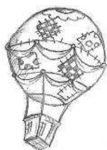
Воздушный шар Капитана Небо