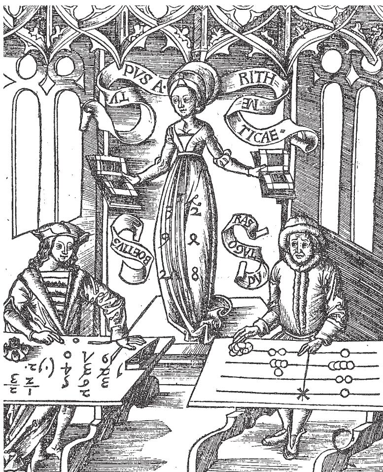
Гравюра XVI века, созданная монахом-картезианцем Грегориом Рейшем. Справа изображен Пифагор за средневековой счетной доской, на которой сформированы числа 1241 и 82. Слева — Боэций, который использует для счета знакомые нам по сей день индийские цифры. В центре — символ Арифметики. На ее платье художник разместил арифметическую и геометрическую прогрессии: 1, 2, 3, 4 и 1, 3, 9, 27