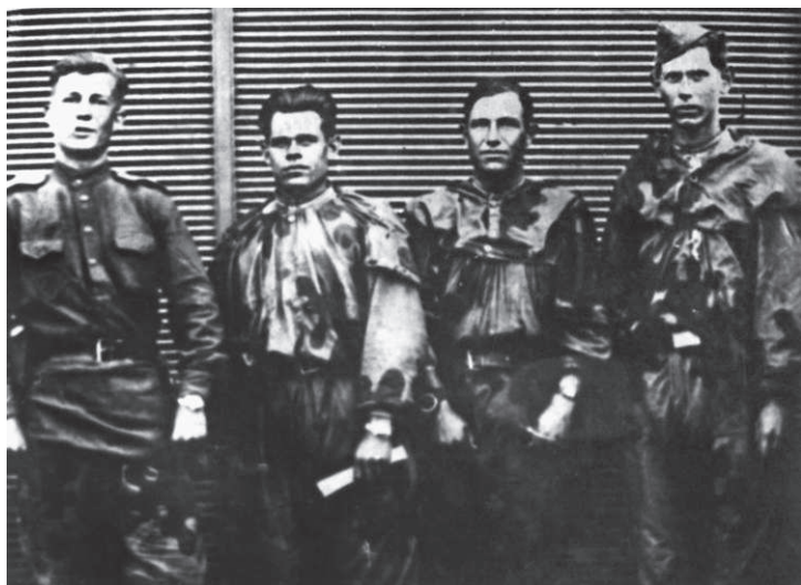
Разведчики 303-й стрелковой дивизии

Основное задание у пеших разведчиков — это достать «языка» любой ценой, разведать оборону противника, его ближние тылы. Если связь прервана с соседями, значит, наладить связь с соседями. Очень часто нас использовали вместо пехоты.