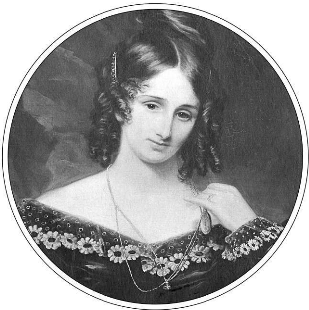
Мери ШЕЛЛИ (1797-1851)