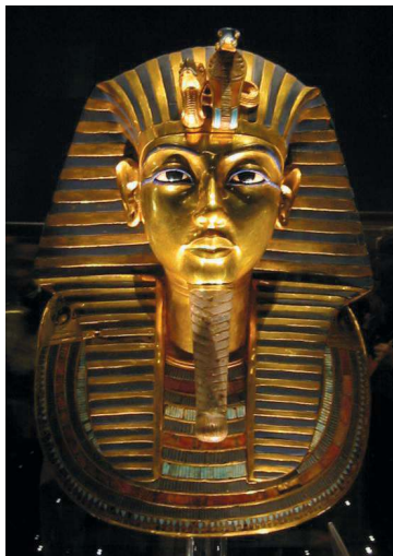
Золотая посмертная маска Тутанхамона

Обе миниатюры плотно заполнены фигурами, на них практически нет пустого места. При этом художнику удалось наполнить картины динамизмом, передав стремительное движение изображенных на них людей и животных. Все мельчайшие детали: украшения на сбруе лошадей,