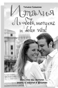
«Италия. Любовь, шопинг и dolce vita!»