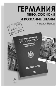
«Германия. Пиво, сосиски и кожаные штаны»