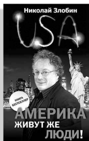
«Америка... Живут же люди!»