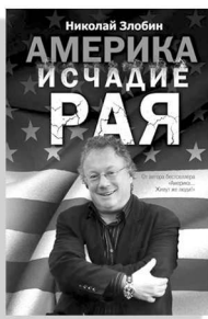
«Америка: исчадие рая»