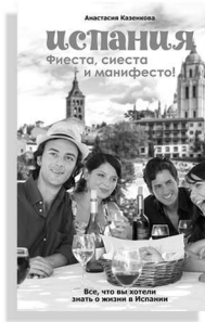
«Испания. Фиеста, сиеста и манифесто!»