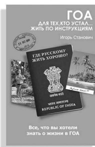
«Гоа. Для тех, кто устал... жить по инструкциям»