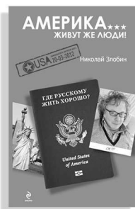
«Америка... Живут же люди!»