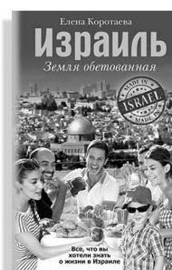
«Израиль. Земля обетованная»