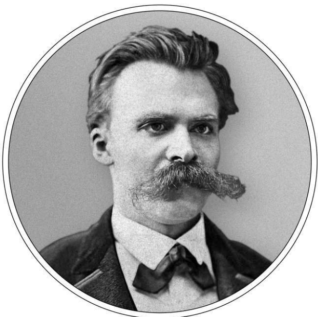
Фридрих НИЦШЕ (1844-1900)