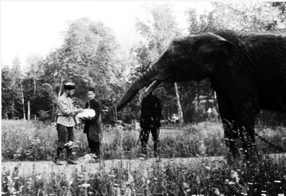
Николай II и слон в Царском Селе

ном в Царском Селе павильоне в индийском стиле («Павильон для слона»). Слоны были добродушны и вызывали умиление у посетителей, ругался только егерь — он жаловался, что животное ежедневно съедает 2 пуда лепешек на чистом сливочном масле. Судьба последнего слона трагична: он был застрелен в 1917 году революционными матросами.