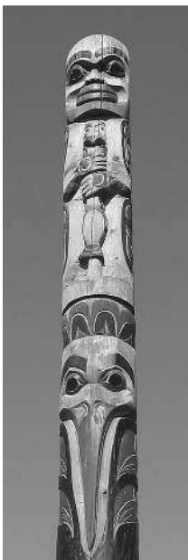
Тотемное изображение в Виктории (Канада)

Человек устроен так, что все пытается понять и познать. Окруженный необъяснимым, он подобен ребенку в темной комнате: а вдруг совсем рядом притаилась неведомая опасность, и никто не придет на помощь? То важное для нас, что бессилён постичь разум, издревле объясняет вера.