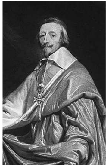
Слева — патриарх Иоаким Московский (1621—1690), икона работы неизвестного художника XVII в., справа — французский кардинал Ришелье (1585—1642), портрет работы Филиппа де Шампenea, XVII в.