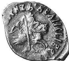
Монеты XV—XVI вв.