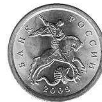
Монета Сбербанка России