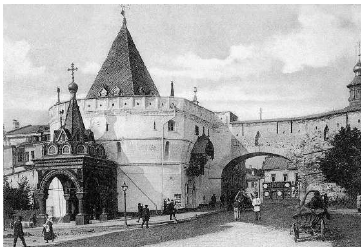
Варв́арские ворота Китай-города на рубеже XIX—XX вв.