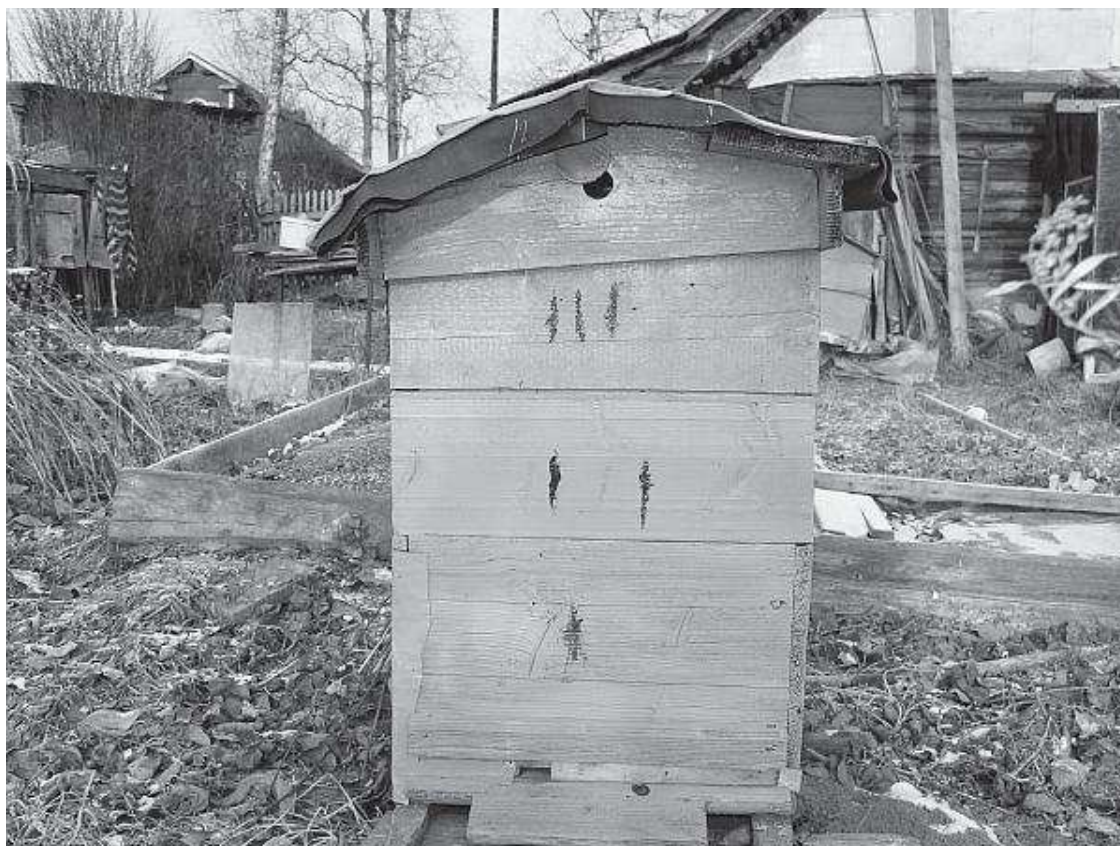
Старинный улей на деревенской пасеке

Начинающему пчеловоду с одним гнездовым корпусом и парой магазинов проще разбираться, где расположено гнездо, а где магазины. Через пару-тройку лет вы можете приобрести и многокорпусной улей. Если вам понравится, остальную пасеку можно расширять только с их помощью. Если нет, не так будет обидно за потраченные деньги. К недостаткам многокорпусных и двухкорпусных ульев относят высокий вес верхнего корпуса. Заполненный медом, он может весить от 30 до 60 кг. Как такую тяжесть поднять, чтобы осмотреть нижний корпус? А если пчеловод – женщина или пожилой человек?