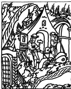
Рис. 1.0.3. Городская кузница.

выпускал якоря массой от 3 до 300 и более пудов. Тяжелые якоря этого завода массой 336 пудов (почти 5,5 т) устанавливали на большие линейные корабли. К концу XVIII в. крупнейшим на Урале становится Ижевский завод. В 1778 г. на нем было отковано 24 якоря массой 60–250 пудов, 134 553 пуда железа. В якорном производстве завода было занято 110 человек.